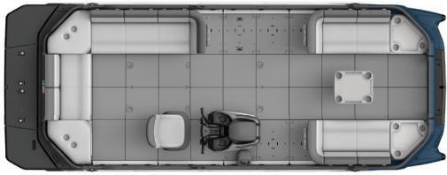
SWITCH CRUISE 21 – 170