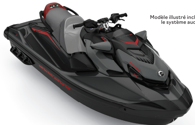
Modèle illustré inclut le système audio

NOUVEAU Noir éclipse et Marsala métallique