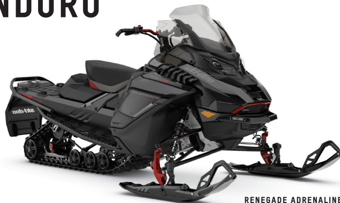
RENEGADE ADRENALINE AVEC ENSEMBLE ENDURO 900 ACE TURBO R MONTRE

Prêt pour l'aventure avec technologies, confort et performances haut de gamme.