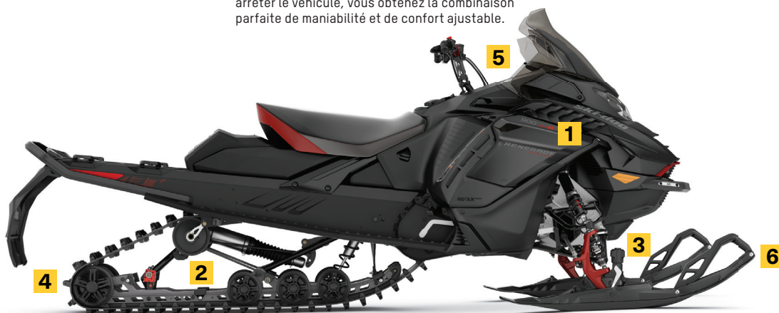
RENEGADE ADRENALINE AVEC ENSEMBLE ENDURO 900 ACE TURBO R MONTRE

Affrontez les virages avec l'assurance d'une suspension avant plus large et les bosses avec une absorption supérieure grâce aux dynamiques optimales. Conçue pour la plateforme REV Gen4 et la suspension arrière rMotion X.