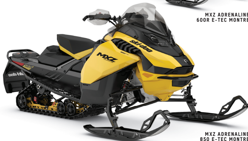
MXZ ADRENALINE 850 E-TEC MONTRE