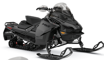
MXZ ADRENALINE 600R E-TEC MONTRE

Virages serrés, bosses imposantes, haute vitesse et sentiers accidentés – une motoneige qui est prête à tout.