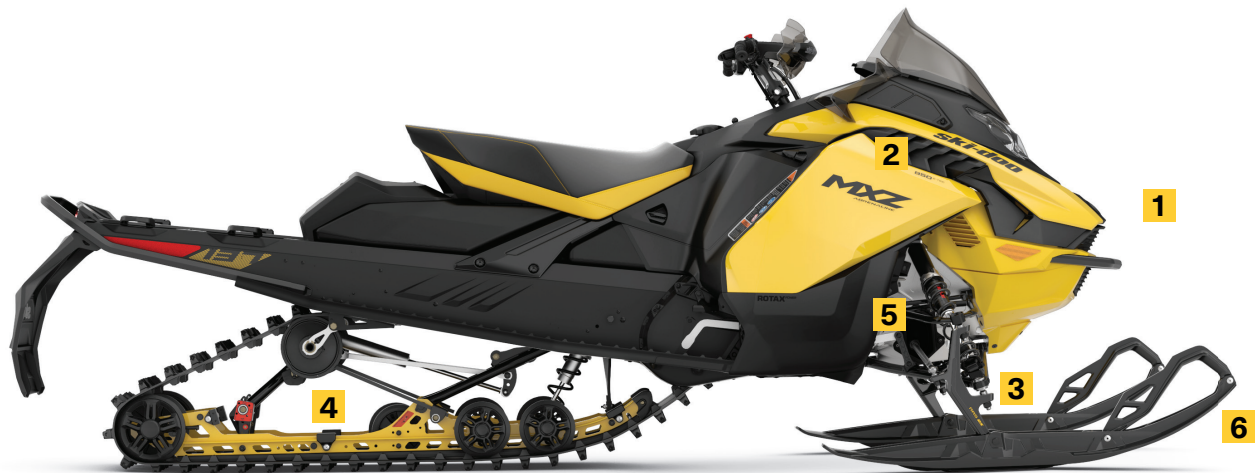
MXZ ADRENALINE 850 E-TEC MONTRE

Inspirée par nos véhicules de course, la suspension RAS RX vous offrira une performance imbattable sur les sentiers difficiles. Conçue spécialement pour une conduite agressive, la suspension vous offrira 20 % moins de roulis pour une maniabilité améliorée dans les courbes.