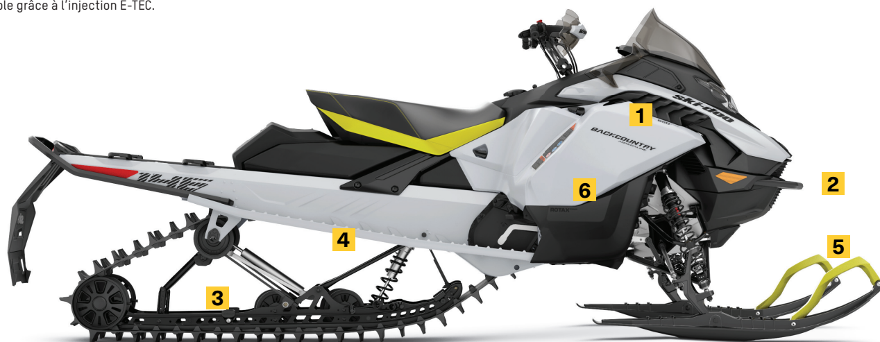
BACKCOUNTRY ADRENALINE 146 850 E-TEC MONTRÉ

La toute nouvelle conception plus légère est mieux équilibrée pour les performances sur et hors-piste. Dispose de plus de transfert de charge pour un facteur de plaisir accru et plus de débattement pour plus de confort et d'absorption des chocs.