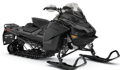
BACKCOUNTRY ADRENALINE 600R E-TEC MONTRE

Modèle hybride entièrement équipé pour passer autant de temps en hors-piste qu'en sentiers.