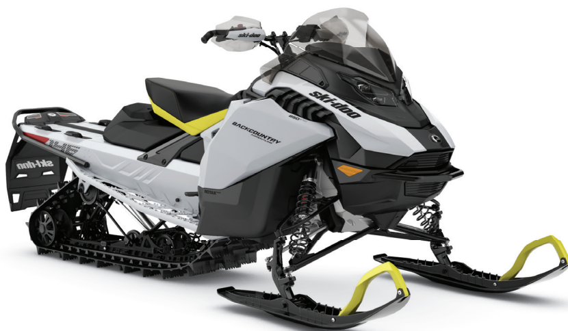
BACKCOUNTRY ADRENALINE 146 850 E-TEC MONTRE