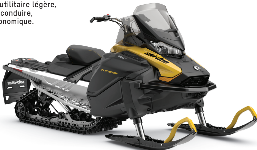
TUNDRA SPORT 600 EFI MONTRE

Motoneige utilitaire légère, agréable à conduire, agile et économique.