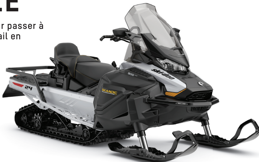
SKANDIC LE 900 ACE MONTRÉ