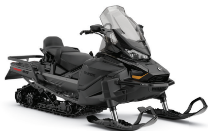
SKANDIC LE 600 EFI MONTRÉ

La motoneige utilitaire idéale pour passer à travers la liste de tâches de travail en hors-piste.