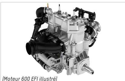
(Moteur 600 EFI illustré)