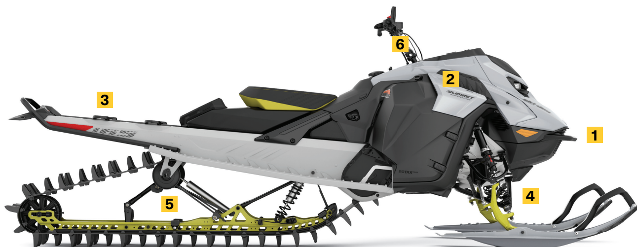
SUMMIT ADRENALINE AVEC ENSEMBLE EDGE 165 850 E-TEC MONTRE

Tunnel court sans garde-neige pour une plus grande capacité en neige profonde et une réduction de poids. Garde-neige léger à l'arrière avec points d'attache LinQ®.