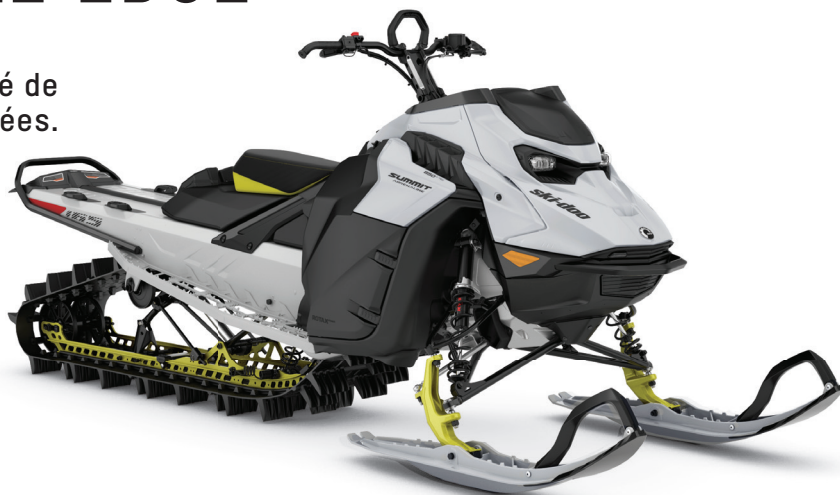
SUMMIT ADRENALINE AVEC ENSEMBLE EDGE 165 850 E-TEC MONTRÉ