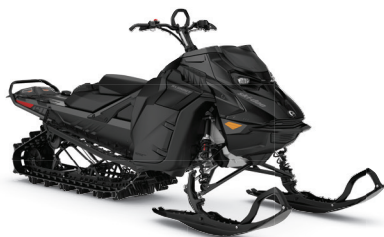
SUMMIT ADRENALINE AVEC ENSEMBLE EDGE 146 850 E-TEC MONTRÉ

Cet ensemble haut de gamme est offert en saison, entièrement équipé de caractéristiques techniques éprouvées.