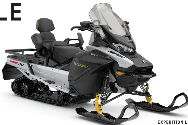
EXPEDITION LE 900 ACE TURBO MONTRÉ

Une motoneige hybride sport-utilitaire parfaite pour les expéditions hors-piste, les randonnées en sentier, et d'agréables journées de travail.