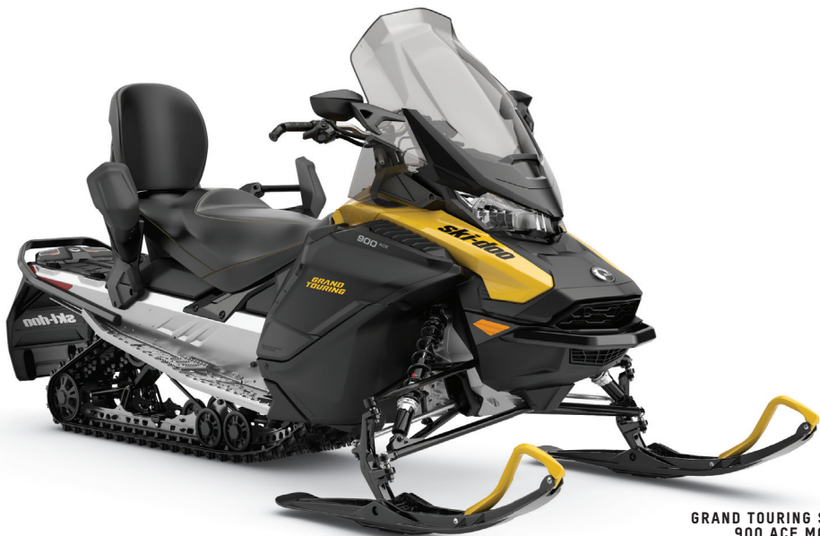
GRAND TOURING SPORT 900 ACE MONTRE

Caractéristique de confort pour deux en sentiers avec maniabilité de précision et style ingénieux.