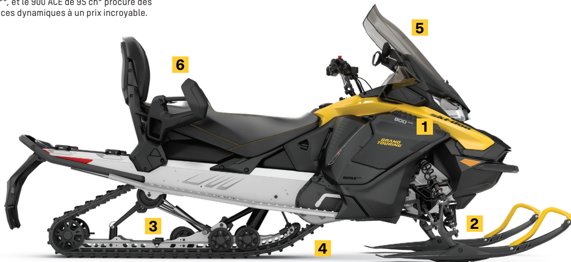
GRAND TOURING SPORT 900 ACE MONTRE

Amortisseur à gaz haute pression KYB de haute qualité procurant des performances et une fiabilité exceptionnelles.