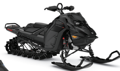
SUMMIT X AVEC ENSEMBLE EXPERT 154 850 E-TEC TURBO R MONTRÉ

La motoneige de hors-piste ultime pour la précision et la prévisibilité équipée de caractéristiques dédiées aux terrains les plus techniques.