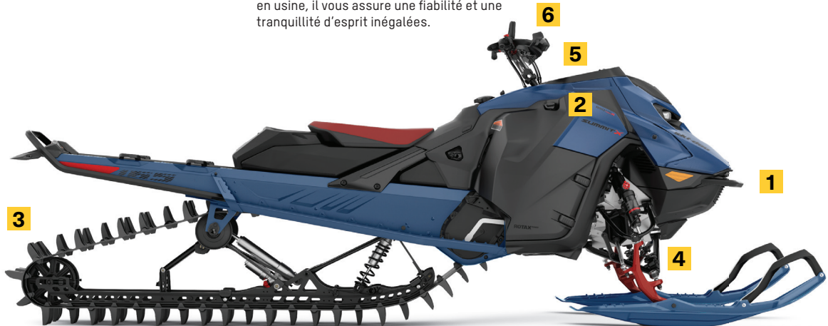
SUMMIT X AVEC ENSEMBLE EXPERT 165 850 E-TEC TURBO R MONTRÉ

Cette chenille repensée de 16 pouces au poids réduit est unique à l'ensemble Expert. Son rebord plus rigide se combine à la tMotion XT pour assurer une rigidité accrue à l'arrière.