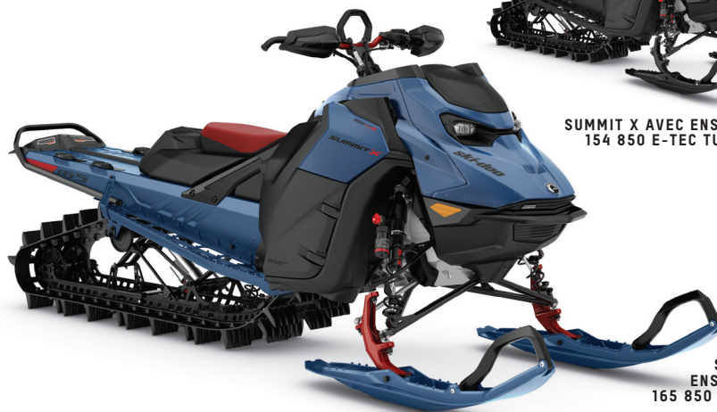
SUMMIT X AVEC ENSEMBLE EXPERT 165 850 E-TEC TURBO R MONTRÉ